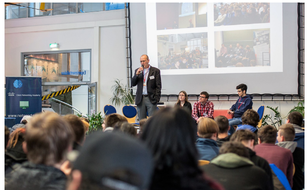
Podiumsdiskussion mit Azubis und Schülern