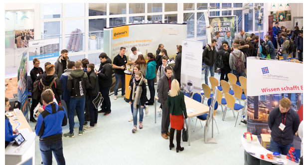
Begleitende Infostände der IT-Unternehmen