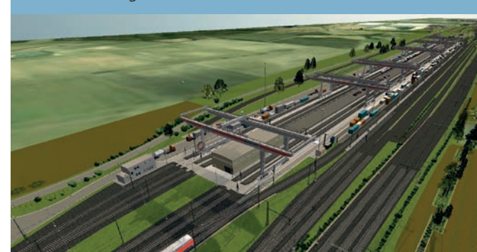
DB Netz AG