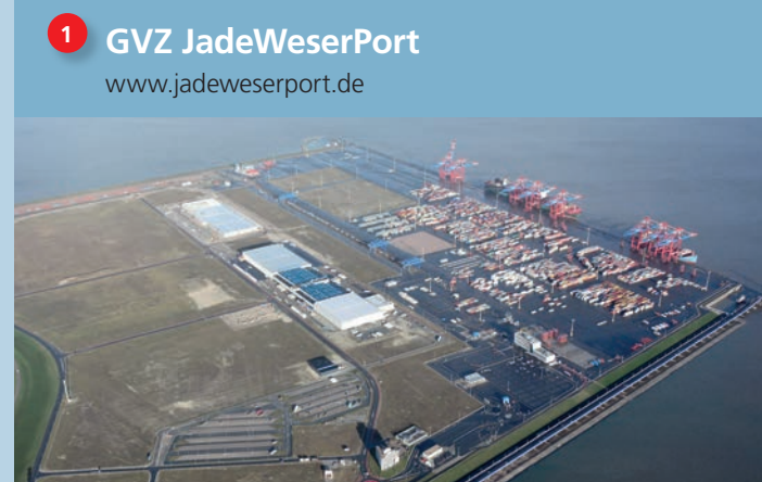
Containerterminal Wilhelmshaven JadeWeserPort-Marketing GmbH & Co. KG